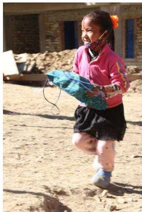
Blijde kinderen in Nepal met hun lespakket