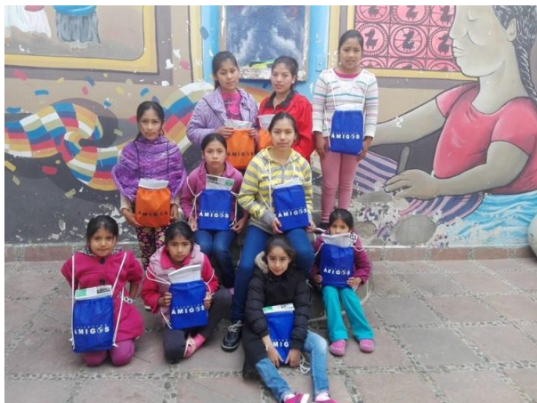
Amigostasje met schoolspullen Misky Wasi

In 2020 heeft Stichting Amigos met het schoolspullenproject bijna 450 kinderen ondersteund. Het jaarlijkse schoolspullenproject heeft Amigos alleen in Sucre kunnen uitvoeren, omdat onze partnerorganisatie Biblioworks door de lockdown de kinderen in de bergdorpjes niet kon bereiken. In samenwerking met de organisaties Mallorca, Misky Wasi, de Mobeiele School en de bibliotheken van Cerpi is deze actie gerealiseerd. Een Amigos-tasje met pennen, kleurpotloden, een schrift, liniaal, gum etc. is een grote hulp voor de kinderen en ouders/verzorgers. Het is een concrete steun en een mooie stimulans om de kinderen te motiveren naar school te blijven gaan.