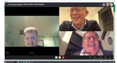
Coronaproof online vergaderen