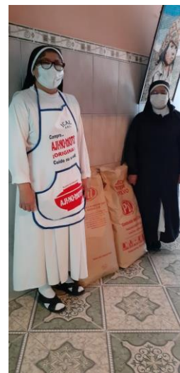
Luiers, vochtige doekjes en twee grote zakken poedermelk