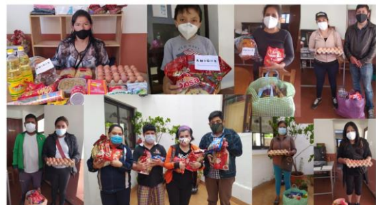
Blij met de levensmiddelen en gezelschapspelletjes

Eind van het jaar hebben we ook nog een donatie gedaan voor therapeutische materialen zoals een oplopende houten staptreden met een hellend vlak en een platform voor de grove motoriek, een sensoriele zak en verschillende soorten poppenkastpoppen.