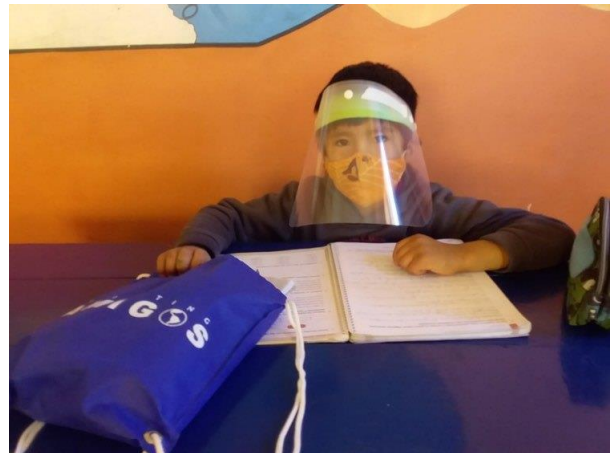
Blijde kinderen bij Sol en Casa Yanapasayku