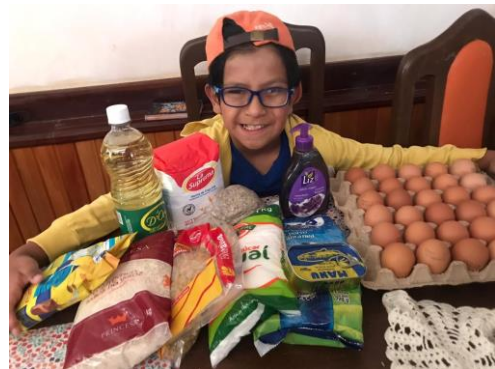
Levensmiddelenpakket voor kwetsbare gezinnen

Vanaf oktober 2020 zijn de coronamaatregelen enorm versoepeld. Na een zware Boliviaanse winter en een jaar uitstel waren er op zondag 18 oktober 2020 opnieuw verkiezingen, waarbij de socialistische partij MAS met als presidentskandidaat Luis Arce heeft gewonnen. De geruchten van fraude gaan weer de ronde, maar door de situatie met COVID-19 en doordat de bevolking moe is van de hele politieke situatie, is het tot dusver nog rustig gebleven in Bolivia. Politiek gezien moet er nog heel wat gebeuren om de rust in het verdeelde land te behouden. Gelukkig is het aantal besmettingen in oktober enorm gedaald. Helaas zien we nu in hartje zomer dat het aantal besmettingen dagelijks weer toeneemt en men vreest voor wat er nog komen gaat. Hopelijk kan Bolivia ook snel het vaccin verkrijgen.