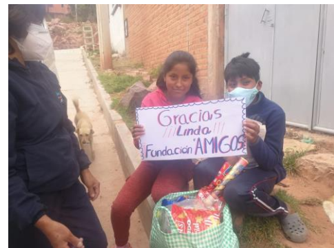
Kerstpakket met het heerlijke Boliviaanse kerstbrood

De economie is in het afgelopen jaar hard getroffen en velen hebben geen werk meer. Aangezien de meeste mensen in Bolivia geen arbeidscontract hebben, is er voor deze mensen ook geen sociaal vangnet en is het nu dus overleven. Amigos heeft in samenwerking met lokale partners zoals de Mobiele School, Cerpi, Sol en Casa Yanapasayku in juli meer dan 200 kwetsbare gezinnen ondersteund met een levensmiddelenpakket. De gezinnen waren blij verrast met de olie, pasta, rijst, eieren en zeep voor de handhygiëne.